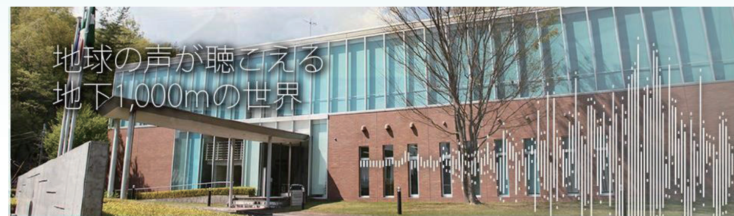
20 years progress since establishment :Tono Research Institute of Earthquake Science (TRIES) Association for the Development of Earthquake Prediction (ADEP)